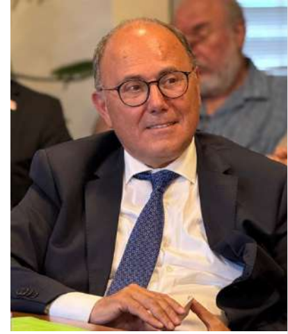
(E) Diplomat Ayhan Doğaner

Al-Kaide'nin 11 Eylül saldırıları ile birlikte, NATO'nun güvenlik stratejisinde değişikliğe gidildi. NATO, Al-Kaide tehdidiyle birlikte küresel asimetrik terörizmle mücadele eden bir yapıya evrildi. NATO, tarihinde ilk kez 5. Madde'yi (kolektif savunma) devreye sokarak ABD öncülüğündeki Afganistan savaşına katıldı.